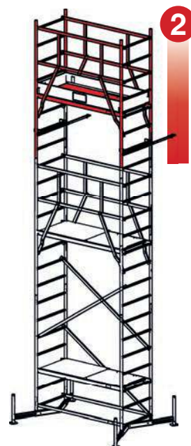
2. Patro 1. Patro Základní lešení

Obj. číslo 710147 Obj. číslo 710123 Obj. číslo 710116